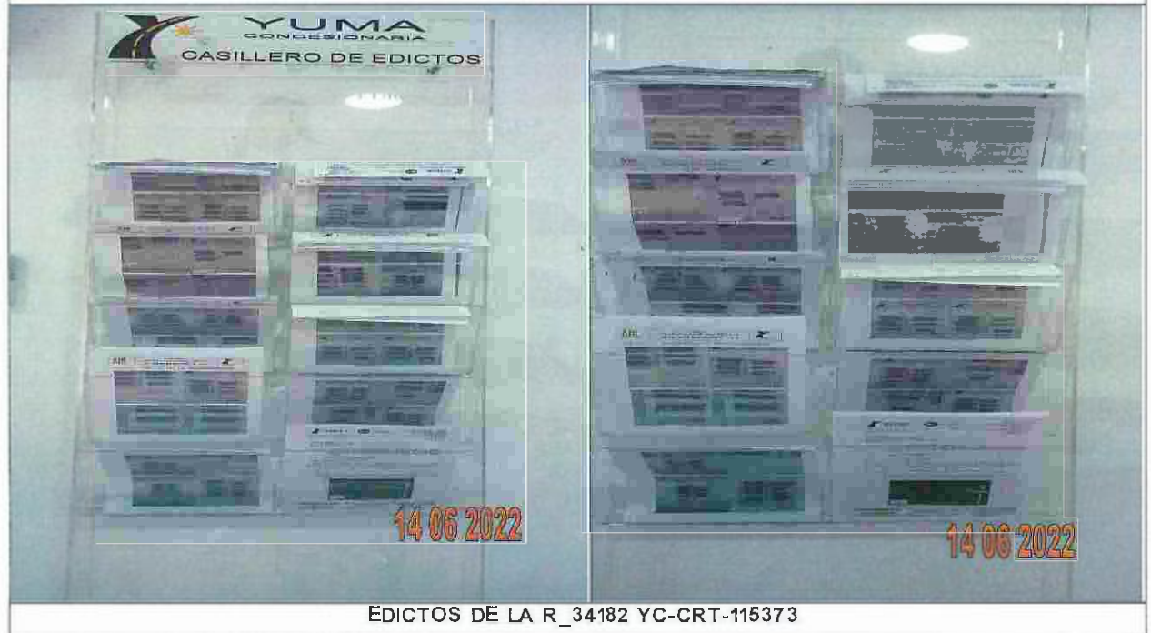
EDICTOS DE LA R_34182 YC-CRT-115373