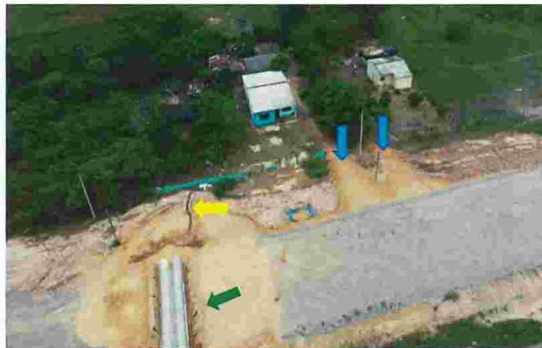
Figura No. 3. Actividades preliminares.