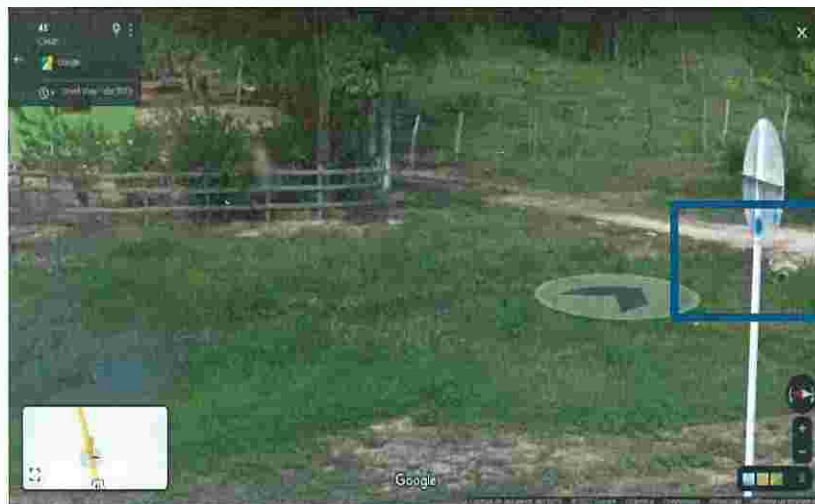
Figura No. 1. Registro histórico antes de la intervención.

Con respecto a este requerimiento, como se evidencia en el registro histórico antes de la intervención de las actividades constructivas, el agua siempre se ha acumulado por estar en una zona de planicie con pendientes mínimas o casi nulas como se evidencian en el registro fotográfico.