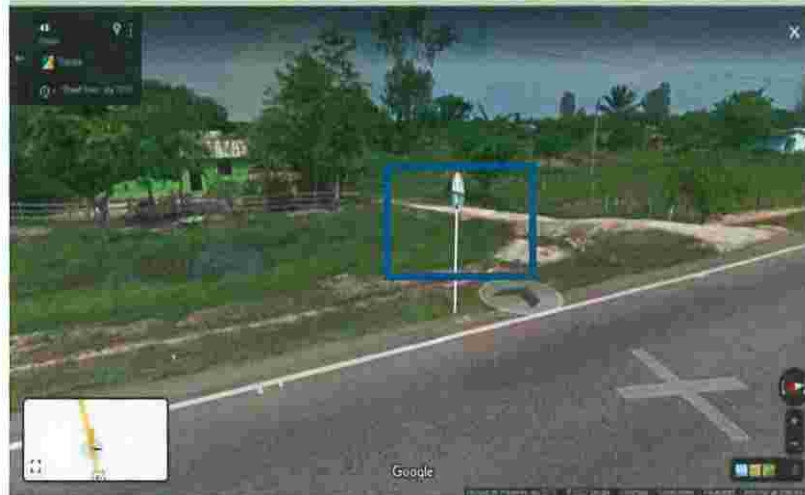
Figura No. 2 Registro histórico antes de la intervención

Aclarado lo anterior y a modo de colaboración, el contratista EPC informa que procedió a realizar las siguientes actividades preliminares: